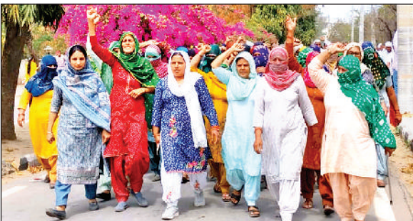
जींद। लघु सचिवालय में नारेबाजी करते हुए महिलाएं।

हरिभूमि न्यूज जींद जयंती देवी मंदिर के निकट नार दिवस शाम को एक युवती ने हांसी बाघ नहर में छलांग लगा दी। इतफाकिया लोगों की नजर नहर में डूब रही युवती पर पड़ गई। लोगों ने तत्काल युवती को सुरक्षित निकाल लिया और पुलिस के हवाले कर दिया। युवती रेलवे रोड की रहने वाली है।