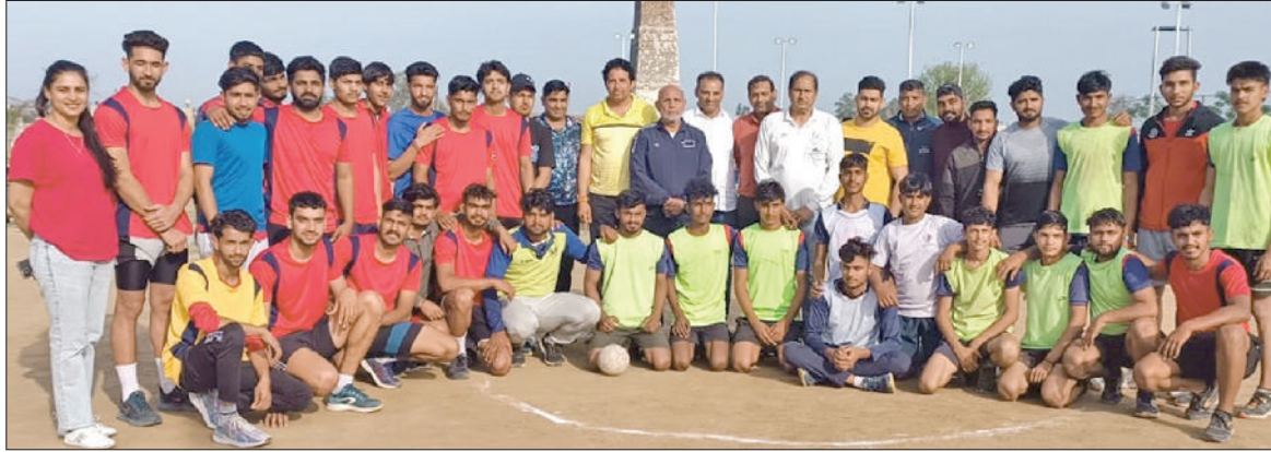
नरवाना। हैंडबॉल टीम को सम्मानित करते हुए।