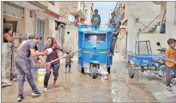
जौड़। होली पर्व पर कोरडे मारती हुई महिला।

गुलाल के बहाने प्यार को बढ़ावा देने वाला तथा अधर्म पर धर्म की जीत का दुल्हंडी पर्व सोमवार को जिलेभर में धूमधाम से मनाया गया। फॉर्ग पर्व पर मारपीट की छुट्टम घटनाओं को छोड़ दिया जाए तो त्योहार शांतिपूर्ण रहा व दो दर्जन से अधिक लोग घायल हुए वहीं सड़कों पर फर्फटा भरते हुए सड़क हादसों में भी एक दर्जन से ज्यादा घायल हुए। हालांकि शांतिपूर्वक तरीके से मने, इसके लिए पुलिस पीसीआर शहर के साथ-साथ क्षेत्रभर में गश्त करती नजर आई। दिनभर लोग एक दूसरे पर रंग-गुलाल-अबीर डाल कर