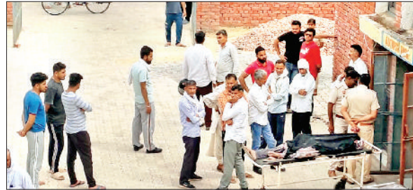
नागरिक अस्पताल में मृतक के शव का पोस्टमार्टम करवाने आए परिजन।