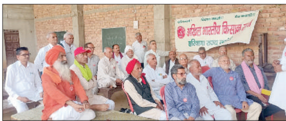
जीद। बैठक करते हुए किसान।