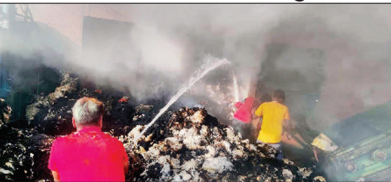
जींद। आग पर काबू पाते हुए फायरब्रिगेड कर्मी।

औद्योगिक क्षेत्र स्थित कॉटन फैक्टरी में सोमवार को दोपहर बाद संदिग्ध परिस्थितियों के चलते आग लग गई। फैक्टरी में मौजूद कर्मियों ने आग पर काबू पाने का प्रयास किया लेकिन आग लगातार फैलती चली गई। बाद में दमकल विभाग के कर्मचारियों ने मौके पर पहुंच कर आग पर काबू पाया। जब तक आग पर काबू पाया जाता तब तक लाखों रुपये की कॉजल जलकर व पानी से