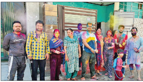
राजौद। होली मनाते हुए युवा, गुलाल लगाने के बाद सेल्फी लेते हुए युवा।

नगर व आसपास के गांवों में रंगों का त्योहार होली धूमधाम के साथ मनाया गया। लोगों ने एक दूसरे को गुलाल लगाकर गले मिलकर होली की शुभकामनाएं दी, वहीं छोटे-छोटे बच्चों ने पिचकारियों में रंग भरकर टोलियां बनाकर एक दूसरे पर रंग डालकर खूब आनंद उठाया। जहां प्राचीन काल से सभी पर्व देश की एकता व अखंडता के लिए अपनी अहमियत को सार्थक सिद्ध करते आ रहे हैं, वहीं रंगों का त्योहार होली आज भी समाज में आपसी भाईचारा