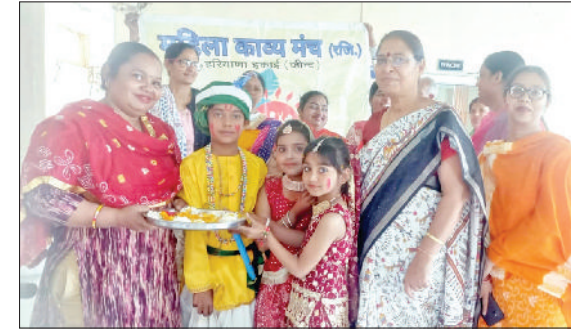
होली का हंगामा, उड़ता है लाल-गुलाल

ने कहा कि यह पर्व प्राचीन काल से मनाया जाता रहा है। बताते हैं कि इस दिन से एक दिन पहले यानी होली के दिन भगवान विष्णु ने धरती पर आकर जनता के ऊपर अपराध करने वाले तथा अपने आप को भगवान बताने वाले दुष्ट राजा हिरण्याकश्यप को मौत के हवाले किया था। शहरभर में जगह-जगह सुबह से ही लोगों ने बड़े स्पीकर व डीजे लगा कर जमकर थिरके।