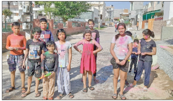
जौड़। होली खेलते हुए बच्चे।

की शुभकामनाएं दे रहे थे। जैसे-जैसे दिन चढ़ता गया वैसे-वैसे मौसम सुहावना होता गया जिसका लोगों ने जमकर आनंद उठाया। युवकों की टोलियां एक स्थान से दूसरे स्थान घूम-घूम कर फाग खेलती रही यह क्रम देर शाम तक जारी रहा। अर्बन एस्टेट, पटियाला चौक, गांधी नगर में सुबह से ही लोगों ने डीजे लगा दिए थे। जिन पर सारा दिन लोग फिल्मी धुनों पर थिरक कर इस त्यौहार का मजा